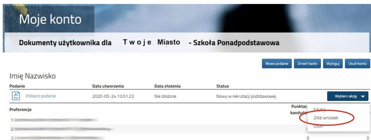
Rysunek nr 2

W kolejnym kroku należy wybrać opcję Złóż wniosek (Rysunek nr 2).